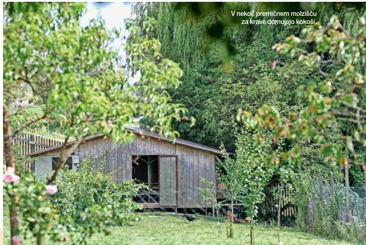
V nekoč premičnem molzišču za krave domujejo kokoši.

»Kadar se ljudje pritožujejo, da se ne da nič spremeniti, da so multinacionalke premočne, da je že vse onesnaženo, jim odgovarjam, da vsak lahko nekaj naredi. Moj prispevek je, da ne zastrupljam zemlje in da ljudem lahko ponudim zdravo hrano. In če bo zaradi moje hrane manj bolnih ljudi, to ni več nezamisljivo.«