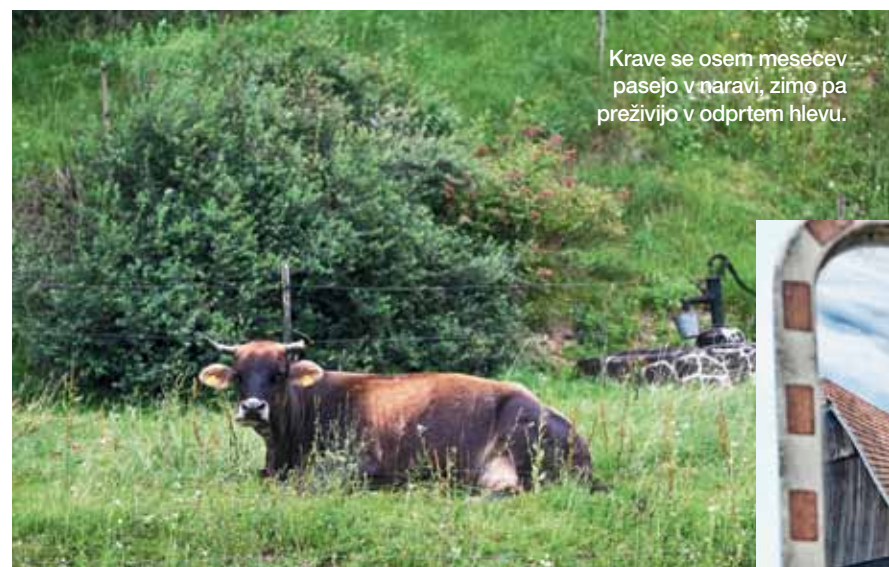
Krave se osem mesecev pasejo v naravi, zimo pa preživijo v odprtem hlevu.

Kmetija Černelič se je v 28 letih z 2,4 ha povečala na 6,5 ha veliko posestvo. Na njem stoji tudi sto let star kozolec, ki je pozimi odprt hlev.