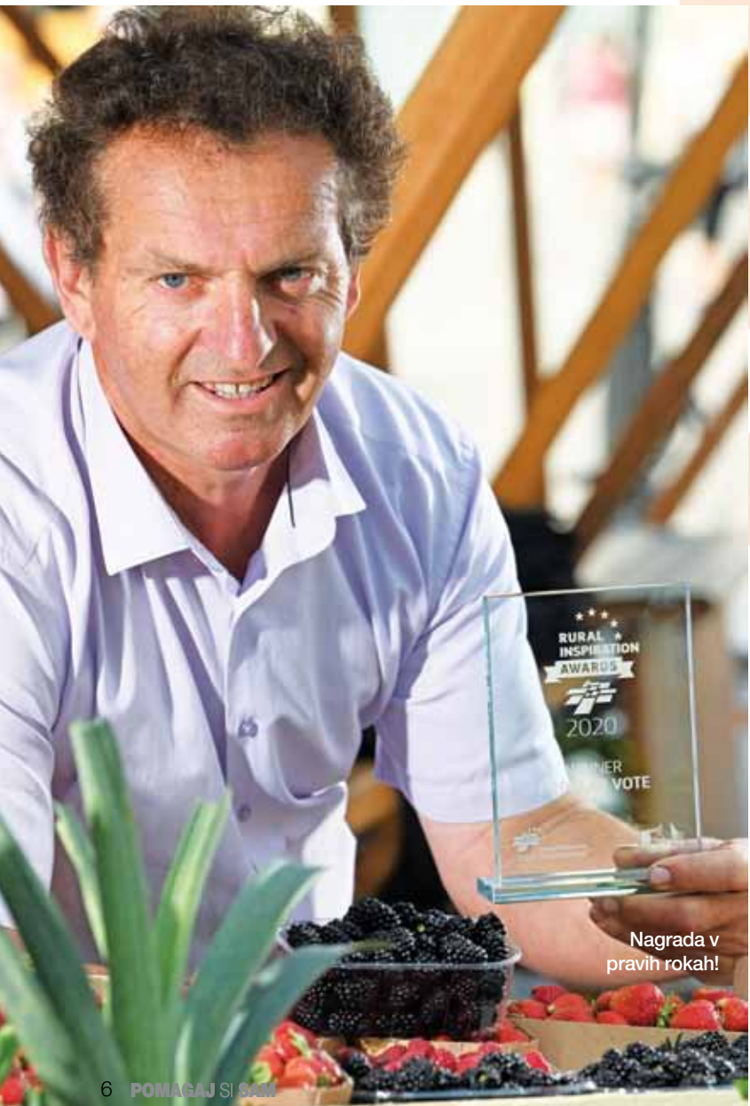
Nagrada v pravih rokah!

»Edini recept za širitev zavedanja, kako pomembna je skrb za naravo, je vzor. Če bi imeli pravega ministra za kmetijstvo in pravega predsednika vlade, bi vedela, da je treba denar začeti preusmerjati od konvencionalnega kmetovanja k ekološkemu.«