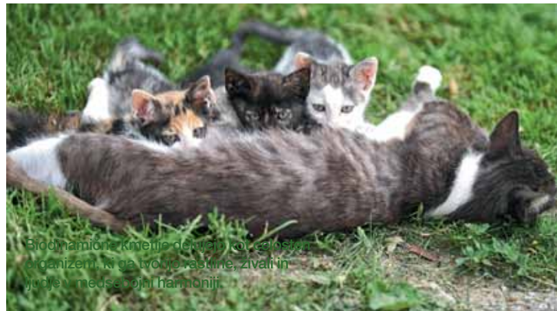
Biodinamično kmetije delujejo kot ekosistemi, organizirani, ki ga tvorijo rastline, živali in ljudi v medsebojni harmoniji.