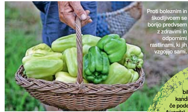
Proti boleznim in škodljivcem se borijo predvsem z zdravimi in odpornimi rastlinami, ki jih vzgojijo sami.