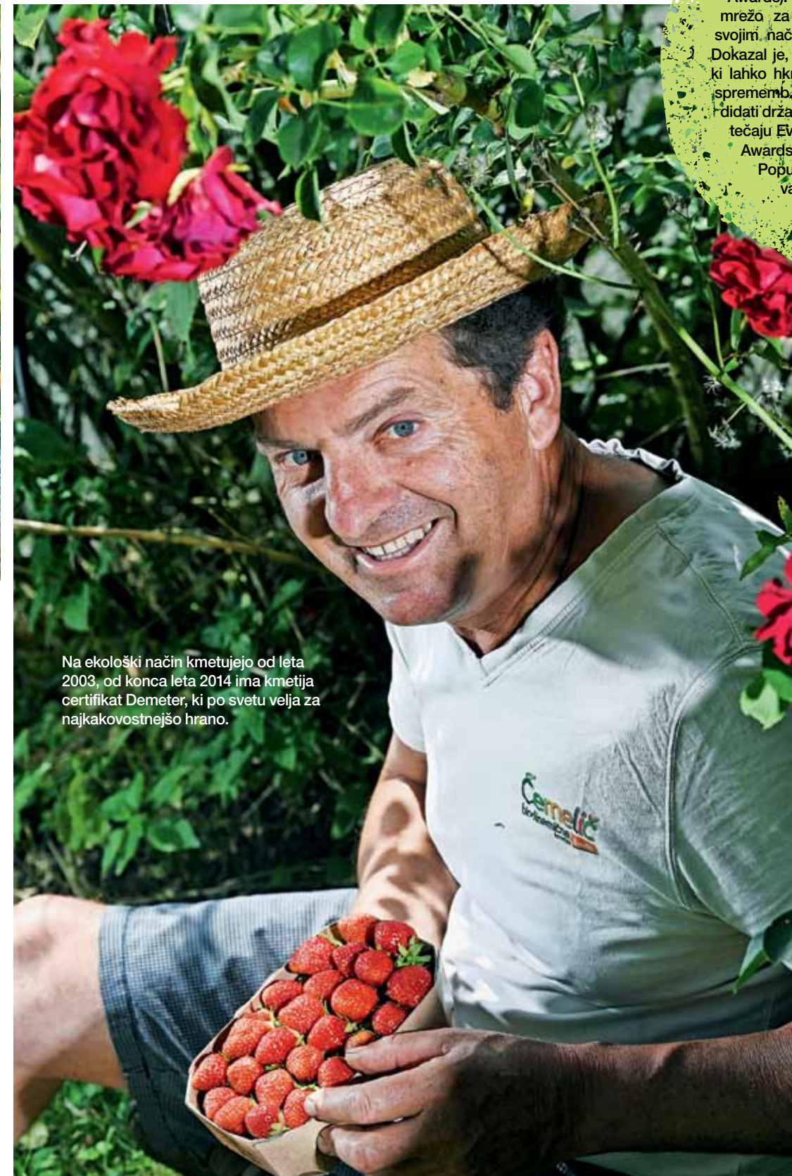
Na ekološki način kmetujejo od leta 2003, od konca leta 2014 ima kmetija certifikat Demeter, ki po svetu velja za najkakovostnejšo hrano.

Ko sta se z ženo, višjo medicinsko sestro, leta 1993 preselila v svojo hišo, sta najprej zasadila jagode. »Povezal sem se z enim od podjetij v Krškem, ki se ukvarja s pridelavo jagod, in po-